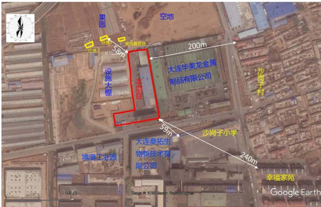
图 3-2 周围环境概况图