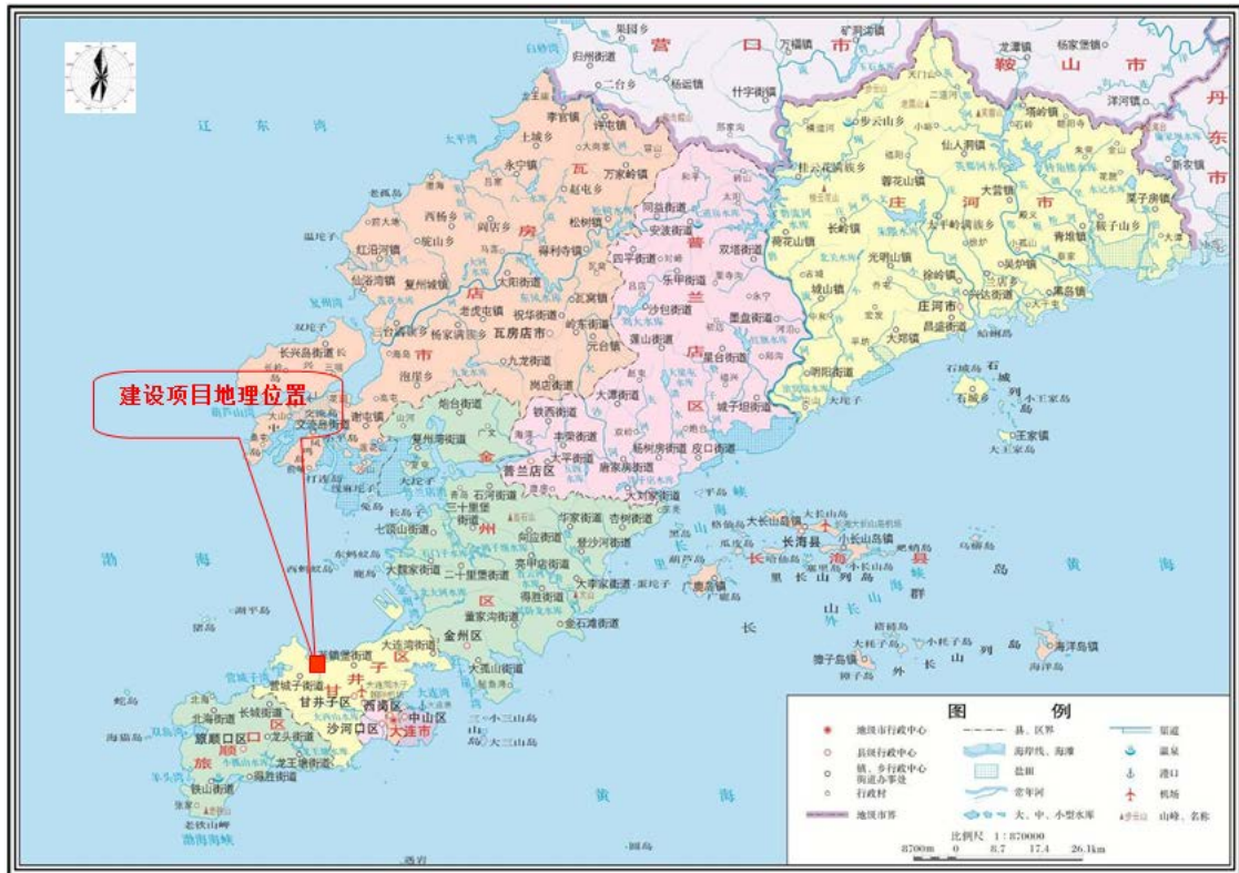
图 3-1 建设项目地理位置图