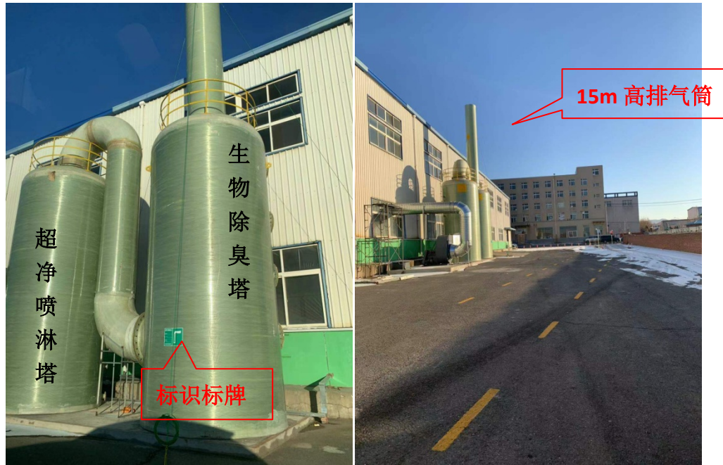
图 4-1 厂区污染防治措施实景照片