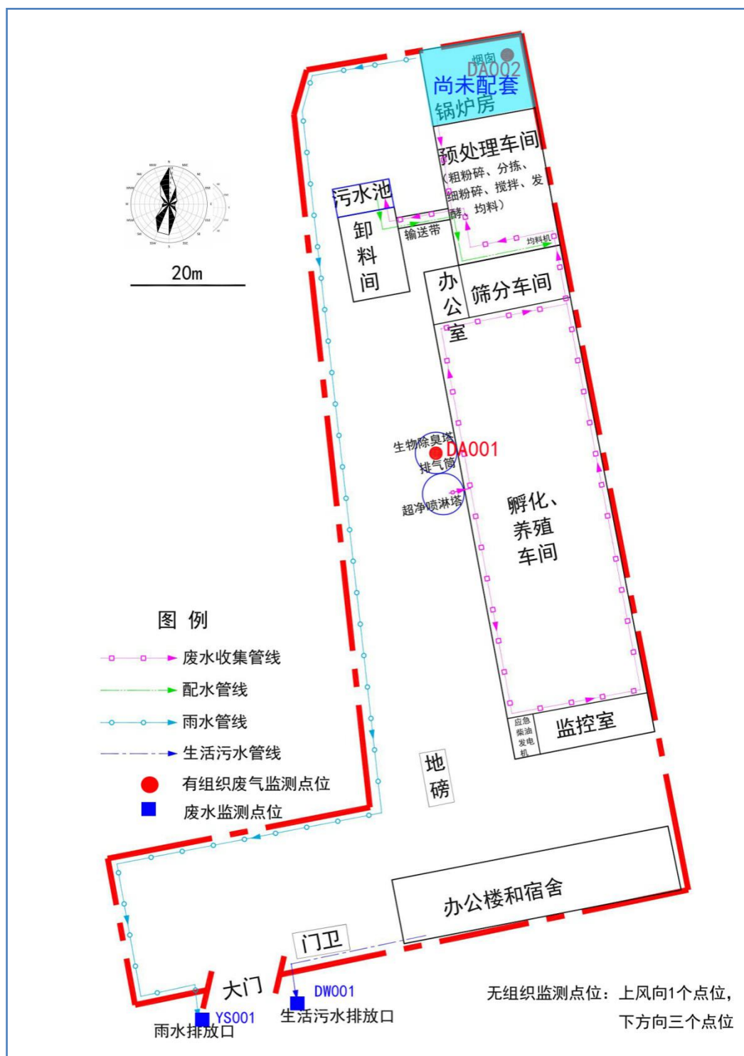
图 3-3 项目平面布局及管网图

项目总占地面积 4000m 2 ，建筑面积 3800m 2 ，租赁原大连境港开关厂厂房一层（2000m 2 ）以及仓库、锅炉房、办公楼 2~3 层。具体见图 3-3。