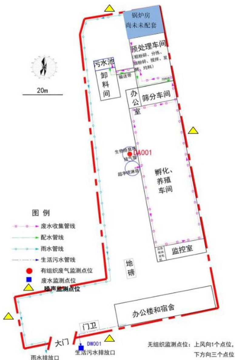
图 7.1 监测点位图